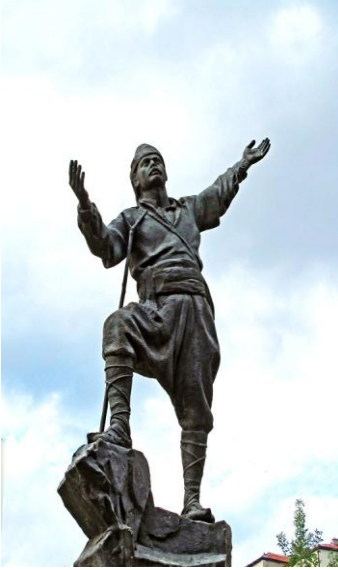
Karaman Yunus Emre Heykeli